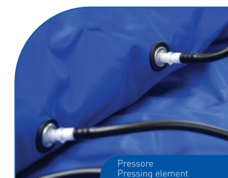
Pressore Pressing element