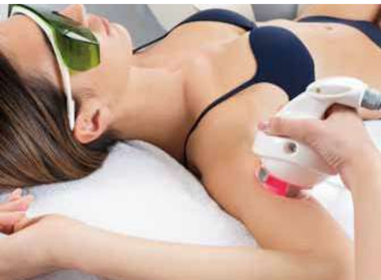
Riduzione delle lassità cutanee Firming up and toning

The device is equipped with an easy to use touchscreen.