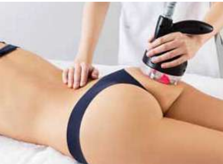
Contrasto dell'ineestetismo della cellulite Targeting cellulite imperfections