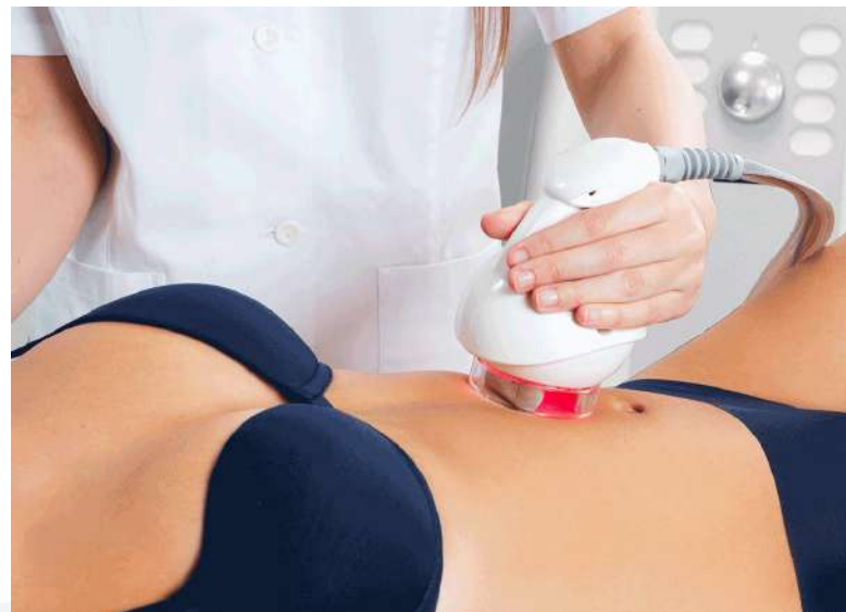
Riduzione dell'adipe localizzato Localized fat reduction