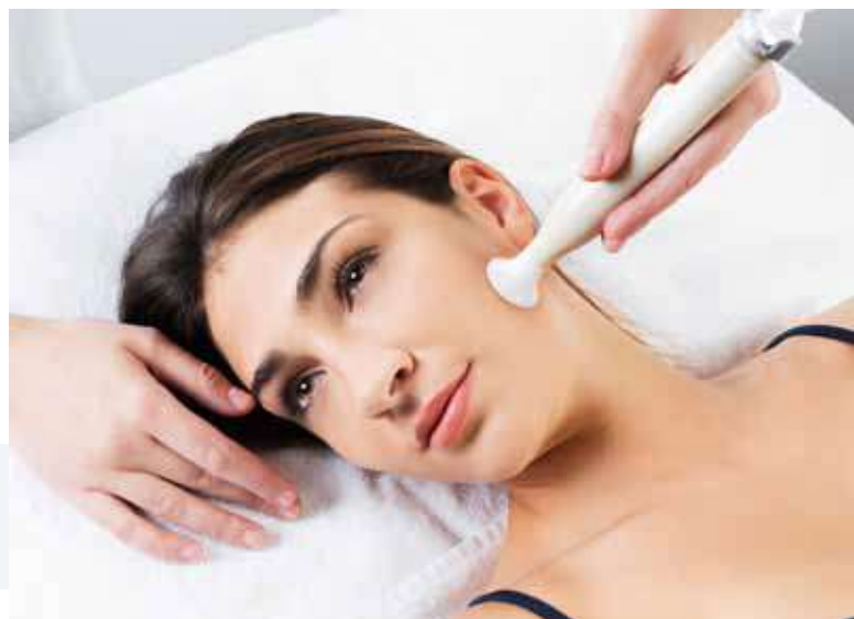
Riduzione delle rughe Wrinkles reduction